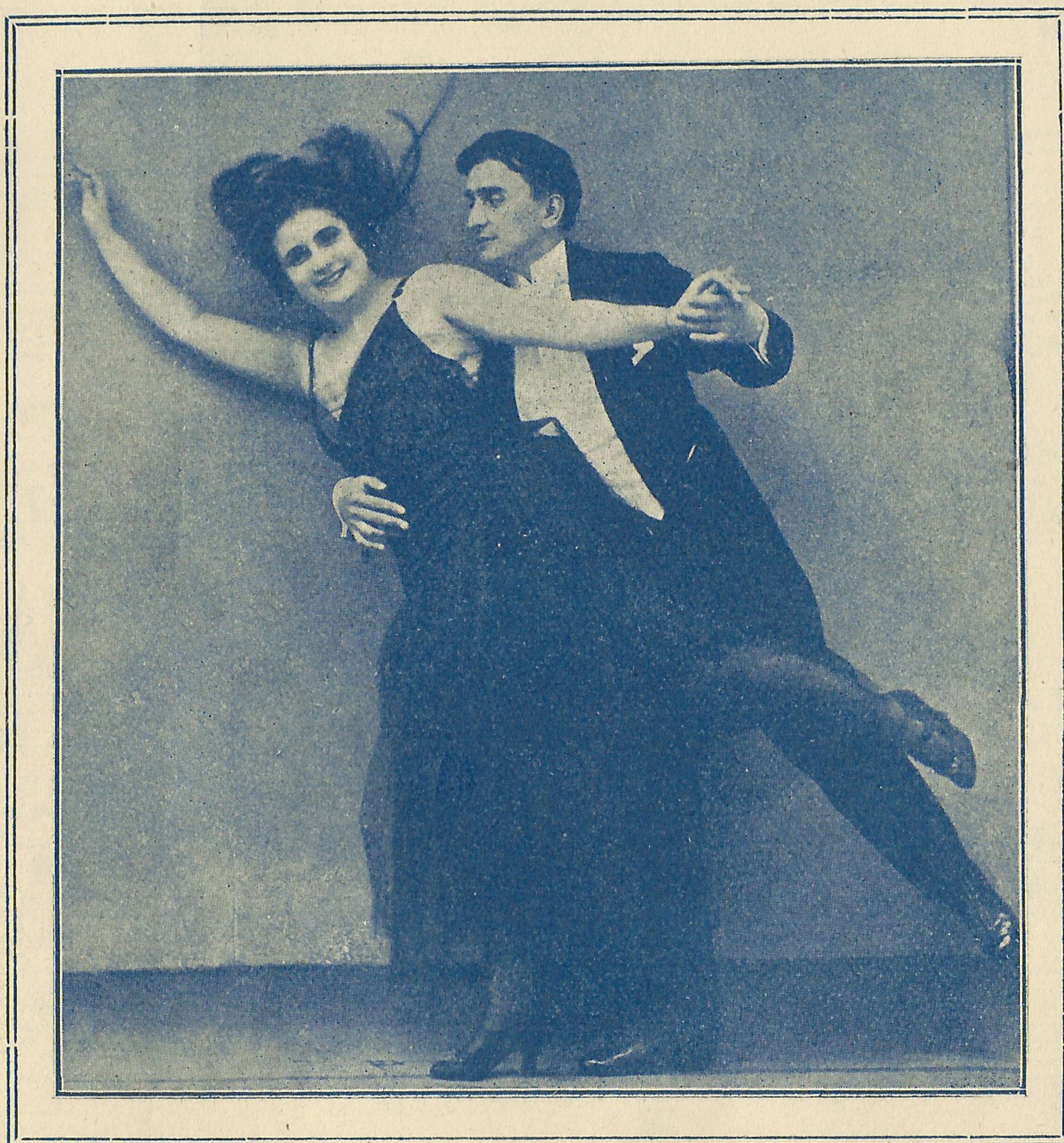
RELEWICZ i BIELICZ.

Nakład i własność B. Rudzkiego w Warszawie.